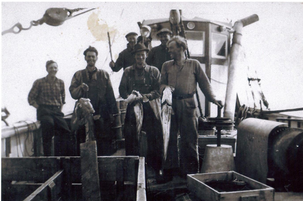
Bild 5. Hemkomna från långafisket med Sweet Home .