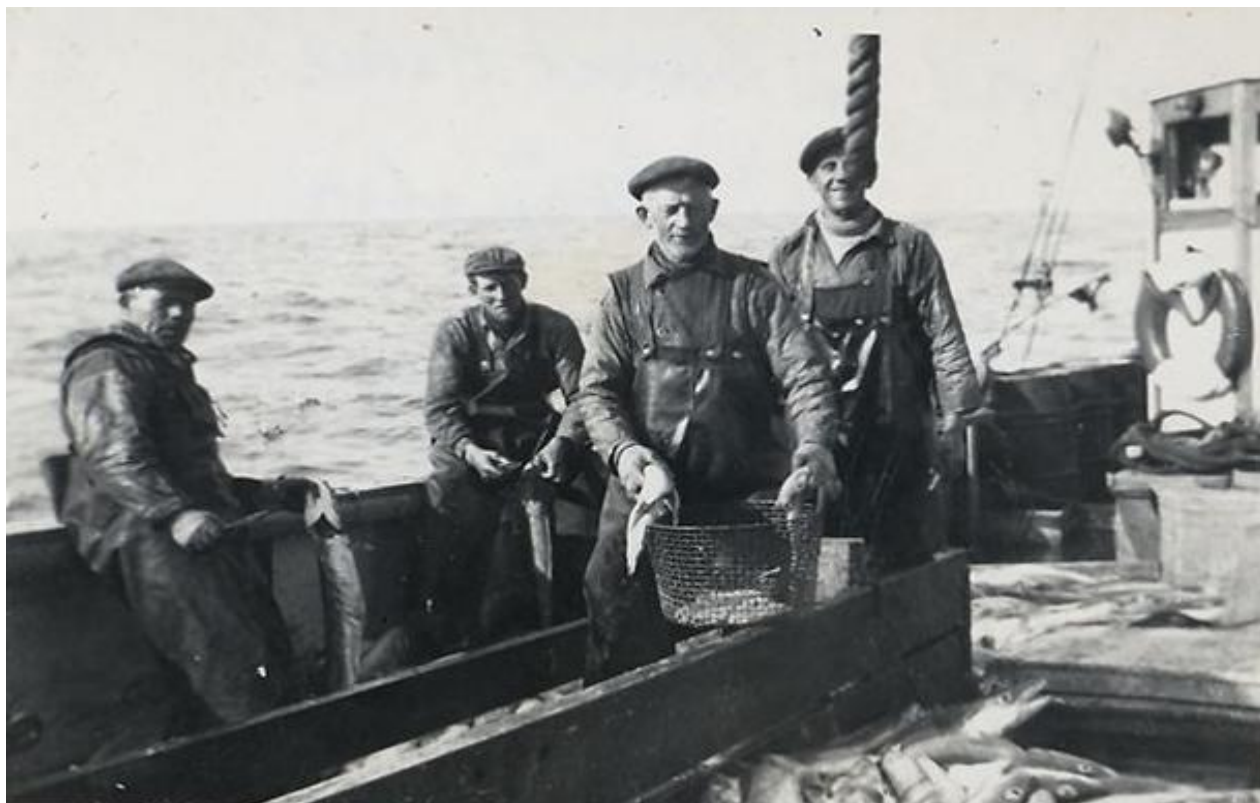
Bild 3. På långafiske med kuttern Sweet Home .