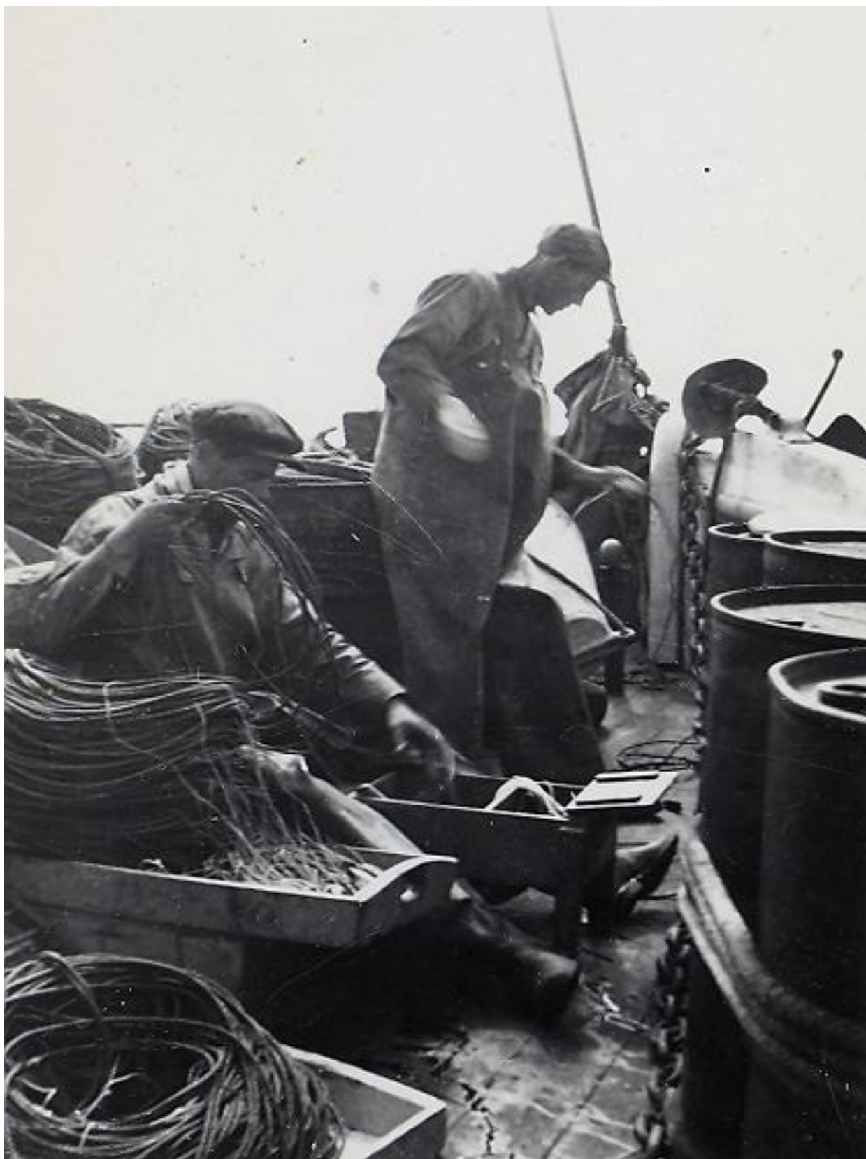
Bild 4. Backorna agnas ombord på Sweet Home .