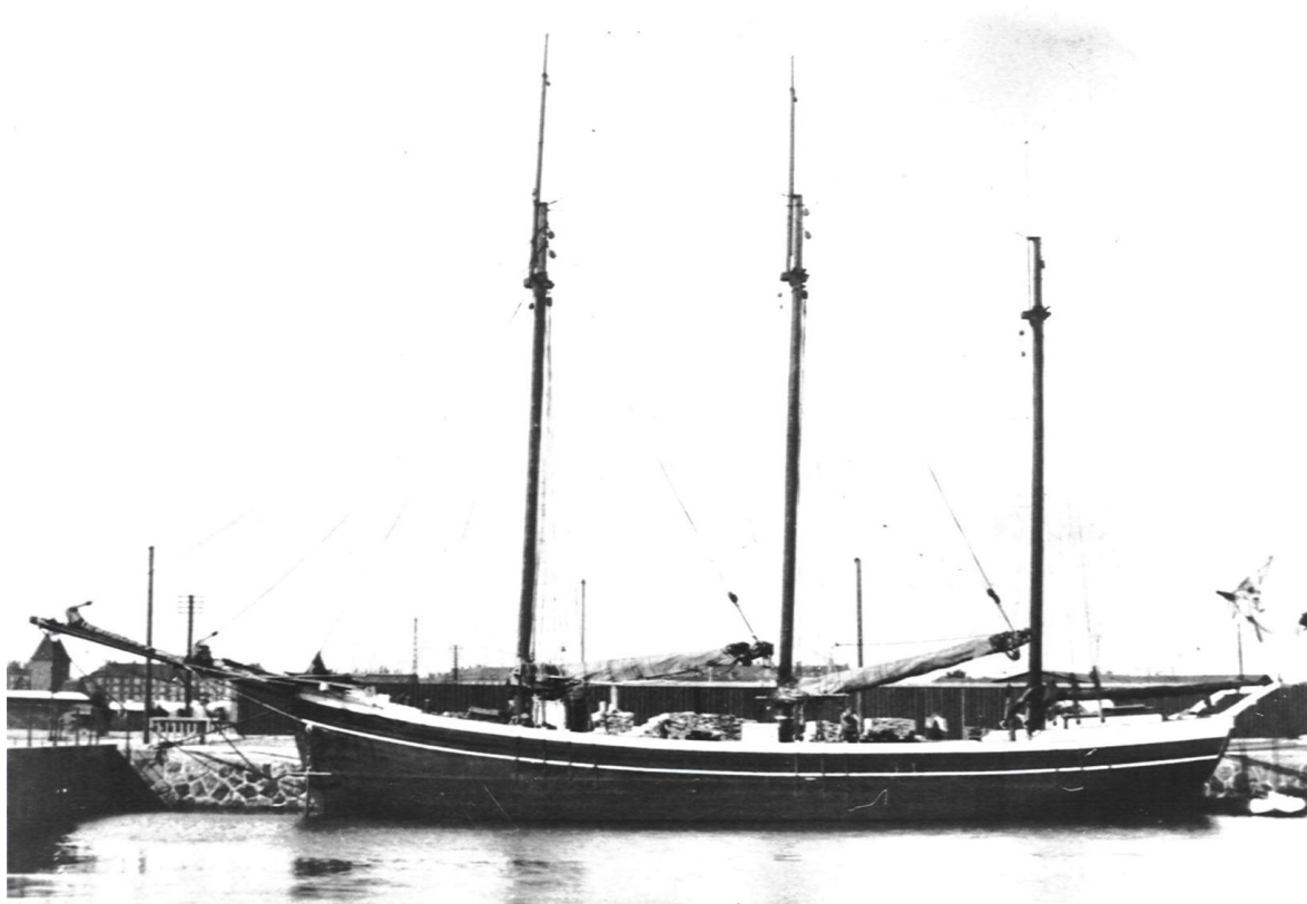
Bild 3. Meta – en slättoppad skonare (slätskonare eller ”hundraelva”) – visar upp sina vackra linjer.

Från fören räknat kallas masterna: fockmast , stormast och mesanmast .