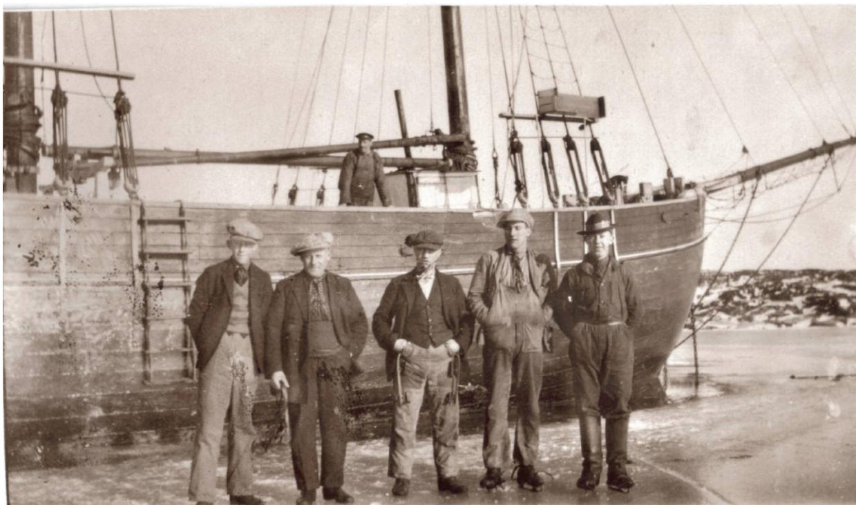
Bild 2. Meta ligger vinterupplagd i isen på Halsefjorden utanför Stocken. 2