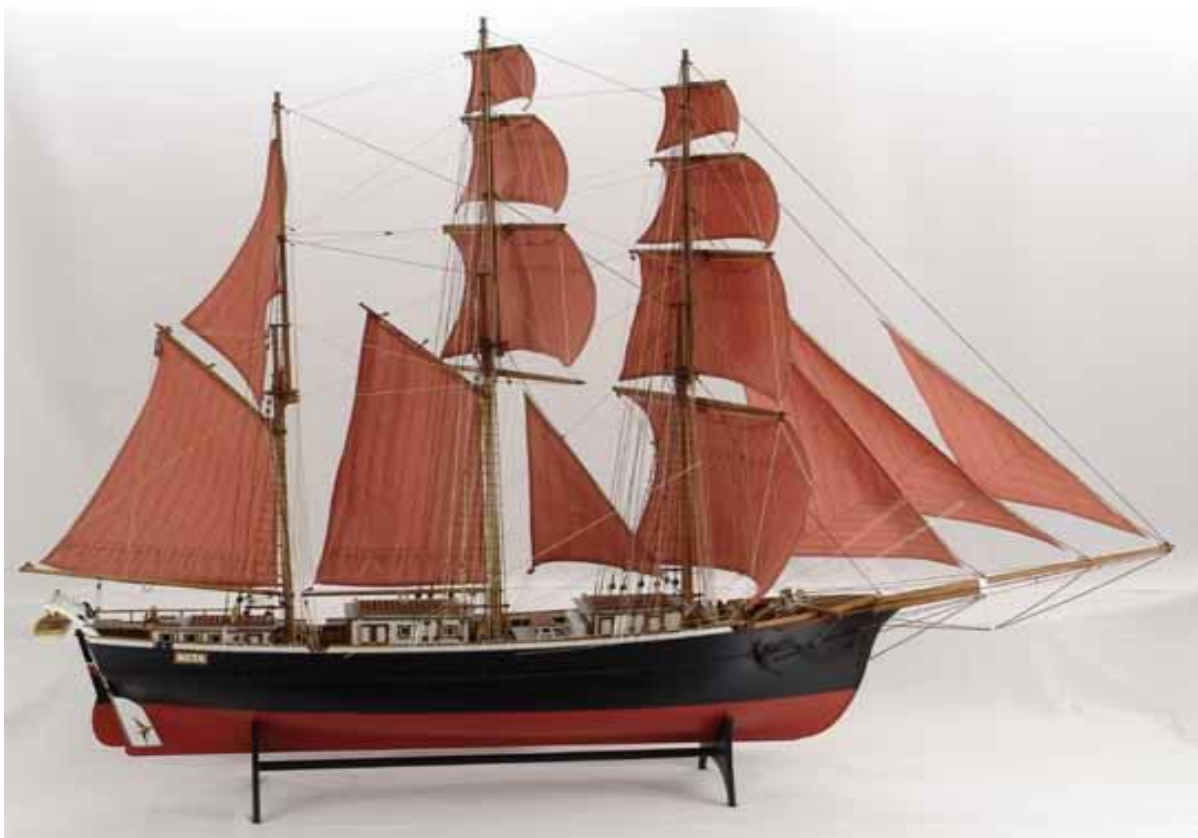
Bild 8. En vacker modell av Meta som skonertbark. Skala 1:25. ( www.modelships.de )