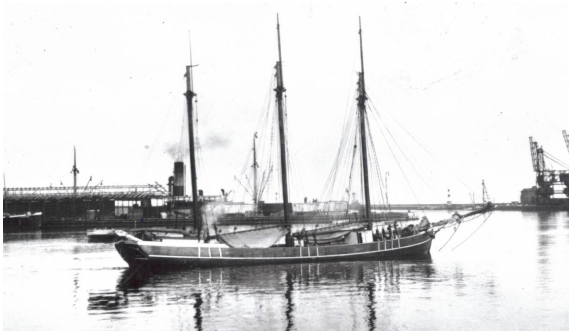
Bild 1. Tremastskonaren Meta med last i en Östersjöhamn.