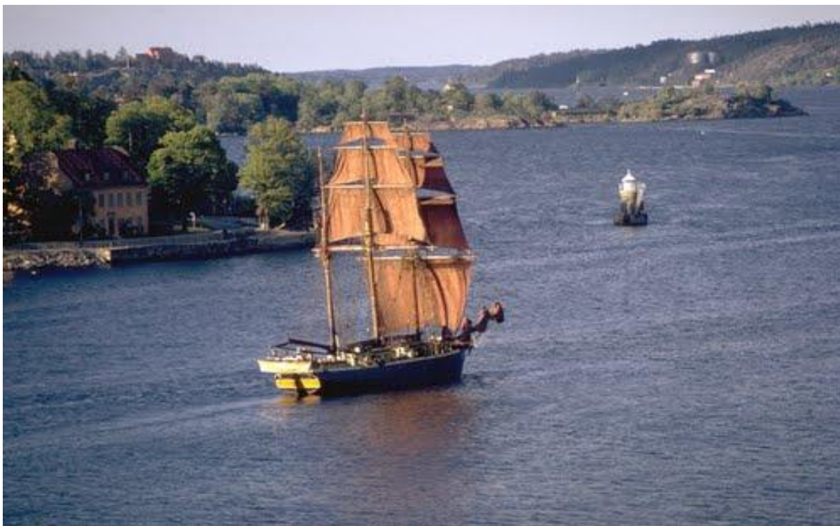
Bild 6. Meta med den nya riggen och nya segel länsande i svag vind utanför Blockhusudden på Djurgården (Stockholm).