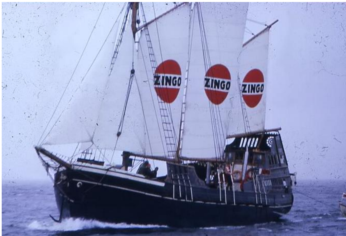
Bild 10. Sjörovarfartyget Meta , bestyckat med kanoner och reklam (1965/1966).