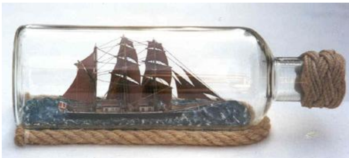
Bild 9. Meta fångad i en flaska. Men stämmer riggen på alla punkter? (Skeppet är byggt av Göran Forss, ansedd som en av Europas skickligaste flaskskeppsbyggare)