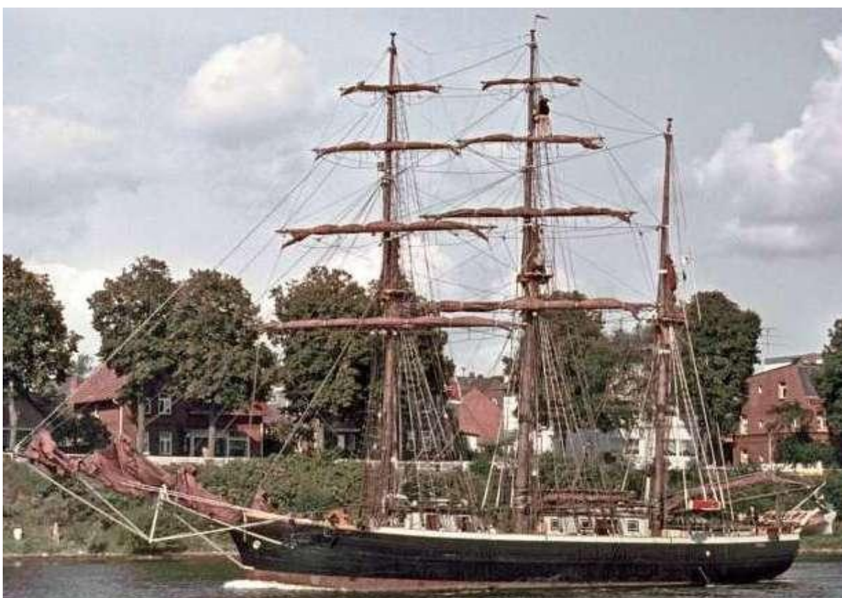
Bild 7. Meta passerar Rendsburg i Kielkanalen, troligen på väg till Medelhavet. Året uppges vara 1971.